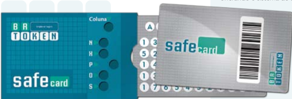
Cartão em material PVC. Simples e prático, cabe perfeitamente na carteira.

Outra vantagem é que, por possuir o tamanho de um cartão comum e espessura total de aproximadamente 1 mm, o SafeCARD pode ser enviado normalmente pelo correio, não onerando o sistema de entregas.